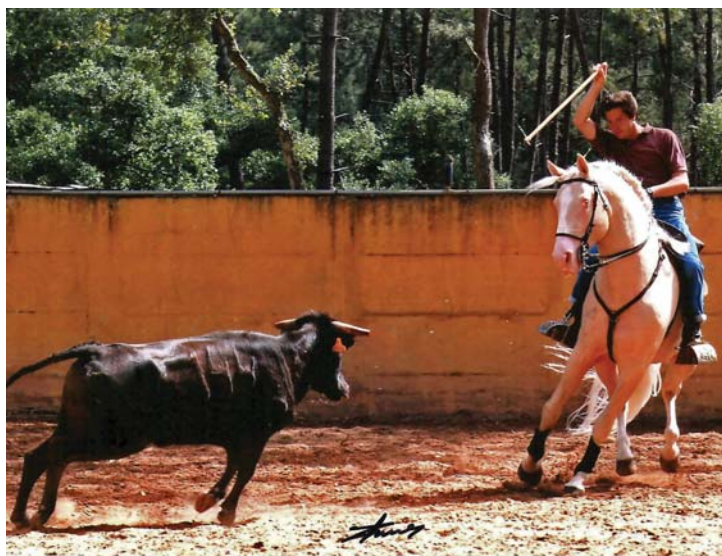
■ Zarco, Puro-Sangue Lusitano de 5 anos, ferro Coudelaria Oliveira Santos é a montada "jóia da Coroa" para o cavaleiro que não poupa elogios às suas aptidões para a tauromaquia